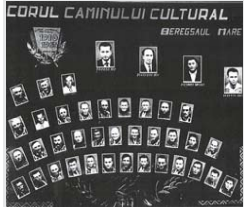
Corul Căminului Cultural Beregsăul Mare