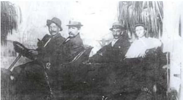
Din Beregsău, în Cleveland

La Beregsau Mare au fost foarte multi care au emigrat in America intre anii 1890-1920.