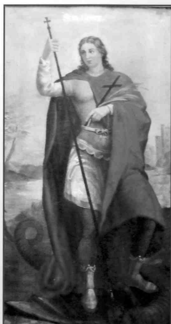
Sf. Mare Mucenic Gheorghe